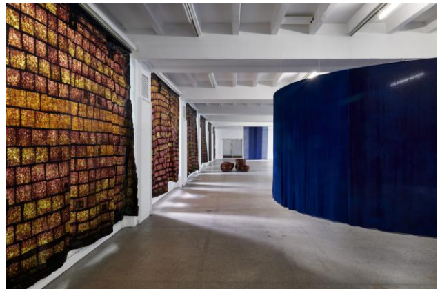
Rauminstallation von Dunja Herzog

Anmeldung: info@koelnischerkunstverein.de